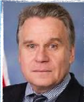
Congressman Chris Smith